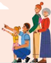
Museo del Tessuto