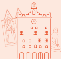
Museo di Palazzo Pretorio