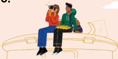
Centro per l'Arte Contemporanea Luigi Pecci